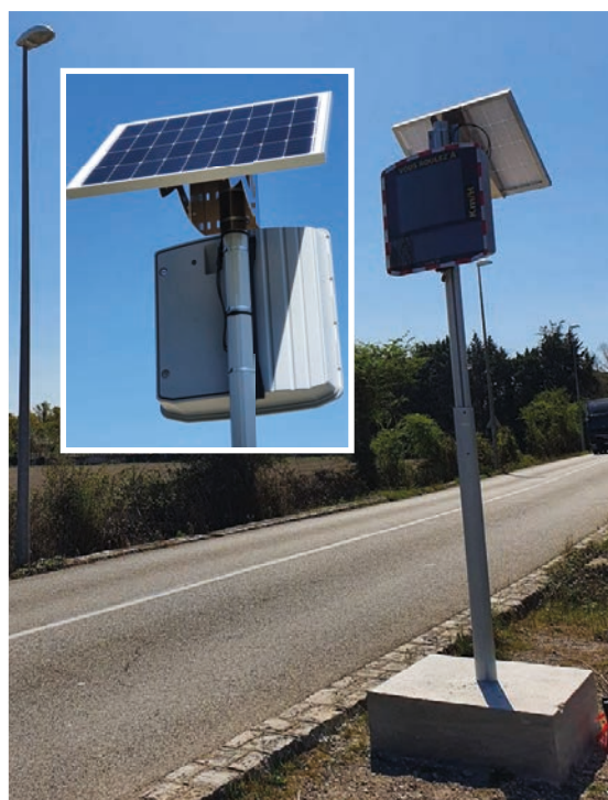
Remplacement du radar pédagogique sur la route d'Orange avec son alimentation solaire.

C'est par une politique globale et transversale que la commune pourra atteindre les objectifs qu'elle s'est fixés en matière de sécurité routière.