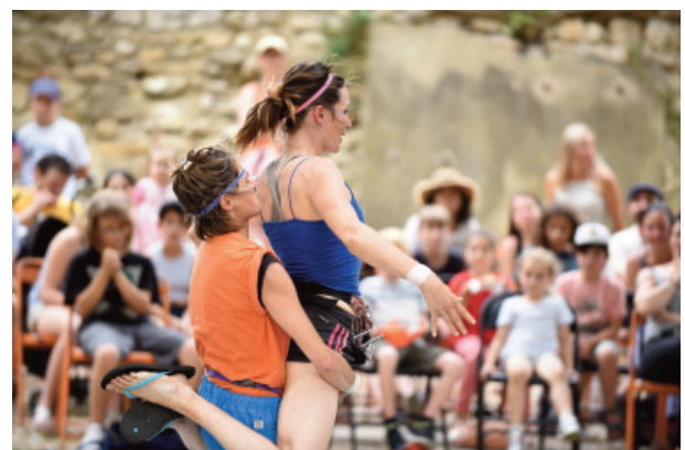
Photos de festivals précédents.